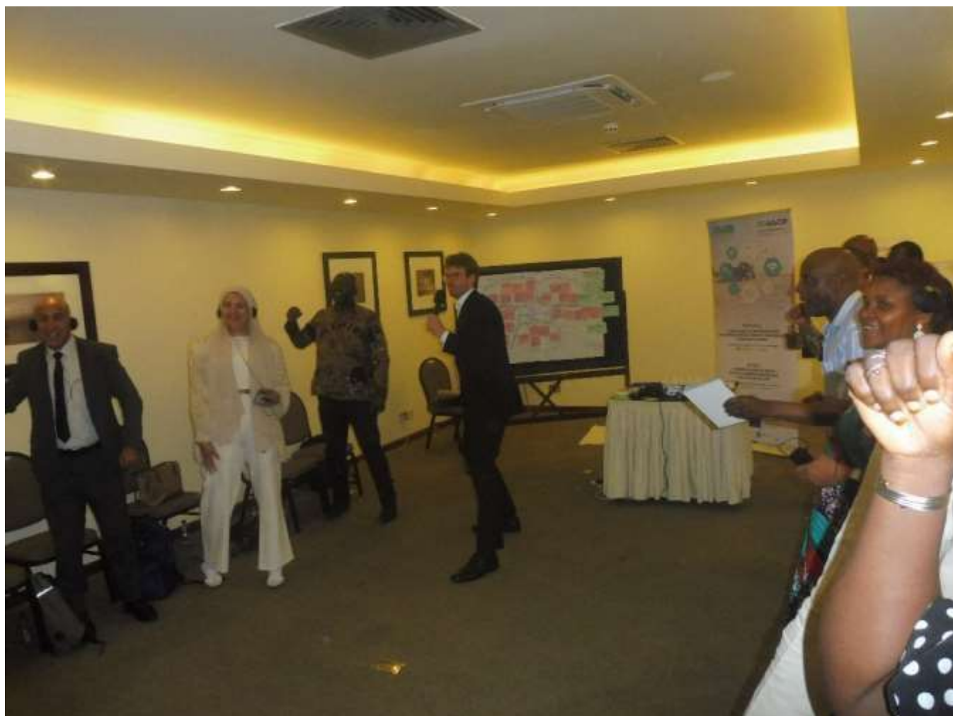
Participants à l'atelier Energizing, juillet 2024