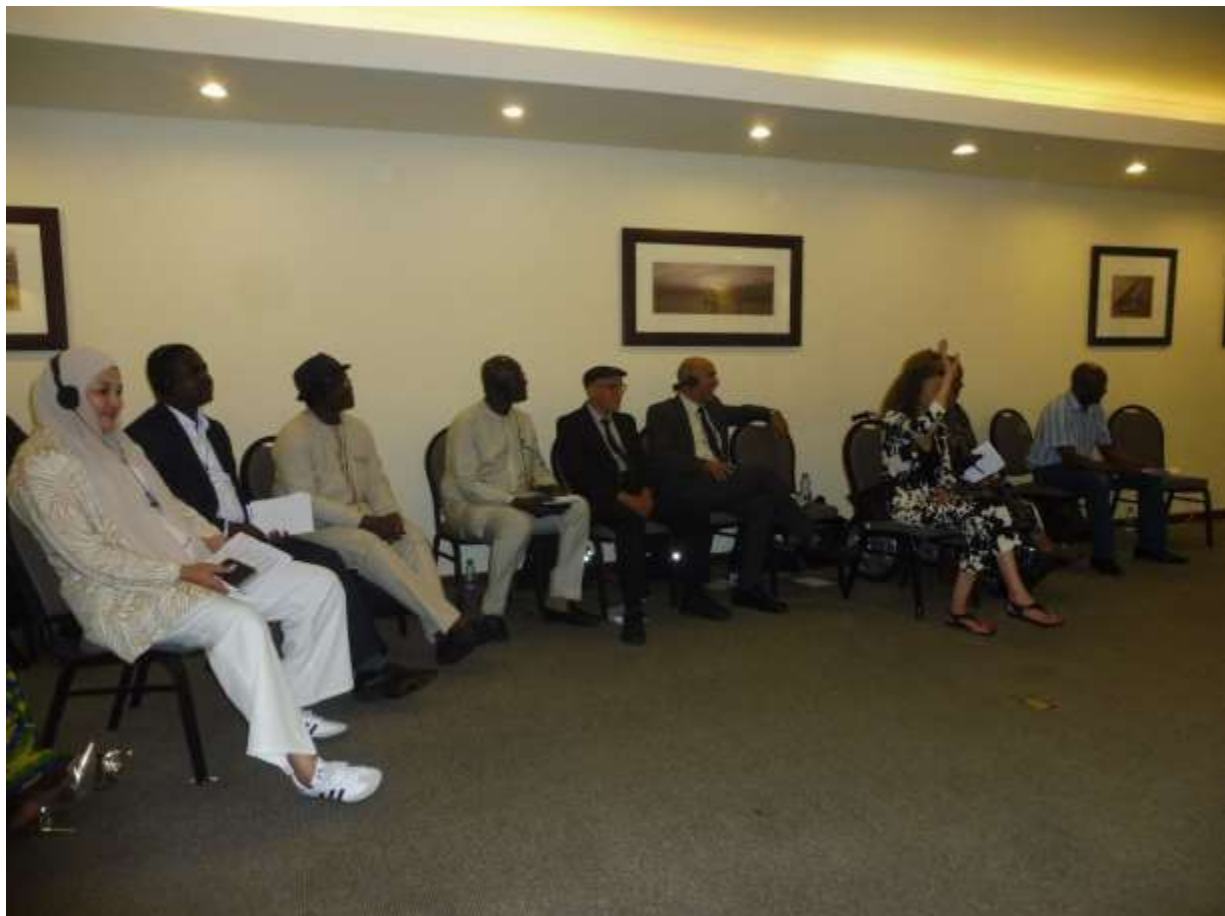
Le président de la PAFO (3e, à gauche), les directeurs généraux et le personnel technique pendant l'atelier. PAFO, juillet 2024

La PAFO a lancé cette initiative pour faciliter la communication et la collaboration entre les différentes organisations paysannes. Le projet s'inscrit dans le cadre d'un effort plus large visant à renforcer les capacités des OPs et à promouvoir une agriculture plus efficace et plus inclusive sur le continent. La plateforme est gérée par un coordinateur de la PAFO et une équipe centrale de modération (CMT), composée de 15 membres sélectionnés par la PAFO, ses réseaux membres et AHA. Cette équipe assiste le coordinateur dans la gestion de la plateforme et l'organisation des sessions.